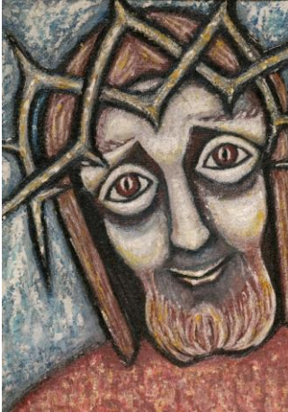
© Hildegard Hendrichs (Bild) / Peter Weidemann (Foto) / In: Pfarrbriefservice.de

„ Ecce homo, Mensch betrachte “, so heißt es in einem bekannten Passionslied. „ Mensch betrachte! “ Betrachten meint, sich Zeit nehmen, genauer hinschauen und das Gesehene wirken zu lassen. Was löst es in mir aus, bekomme ich einen Zugang zu dem, was ich da betrachte? Und dabei ist jeder Mensch anders: Einer schaut intensiver mit den Augen, ein anderer versucht über das gesprochene Wort zu verstehen, ein weiterer lauscht der Musik. All das wollen wir berücksichtigen, wenn wir uns in diesem Jahr wieder jeden Mittwoch in der Fastenzeit um 18:00 Uhr zur Kreuzwegandacht in der