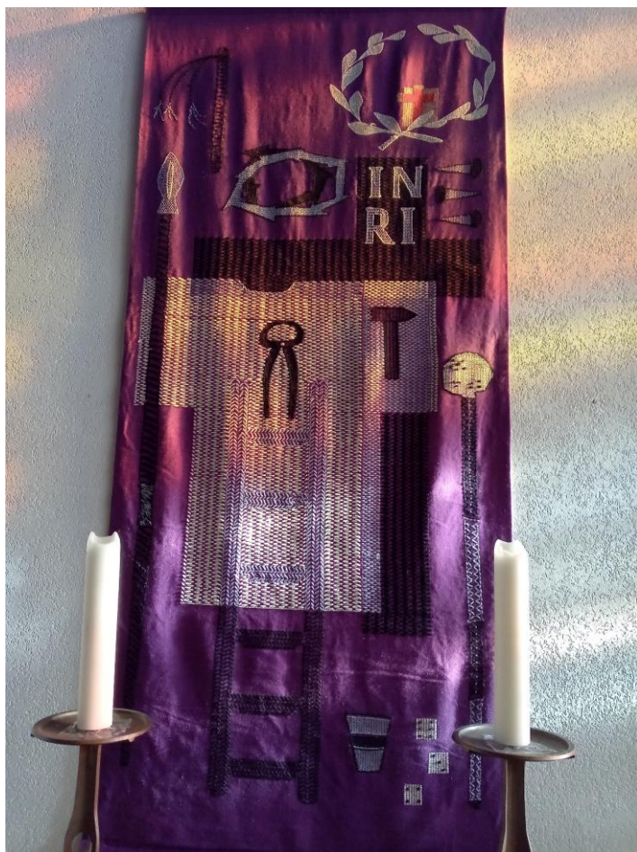
Hungertuch Schmidheim